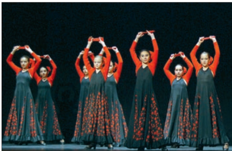
Grupos que han alcanzado algún primer o segundo puesto.