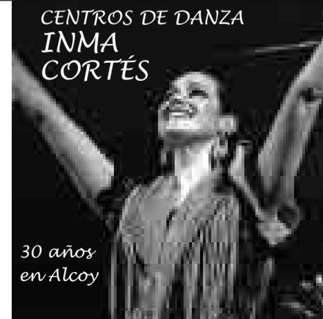
30 años en Alcoy